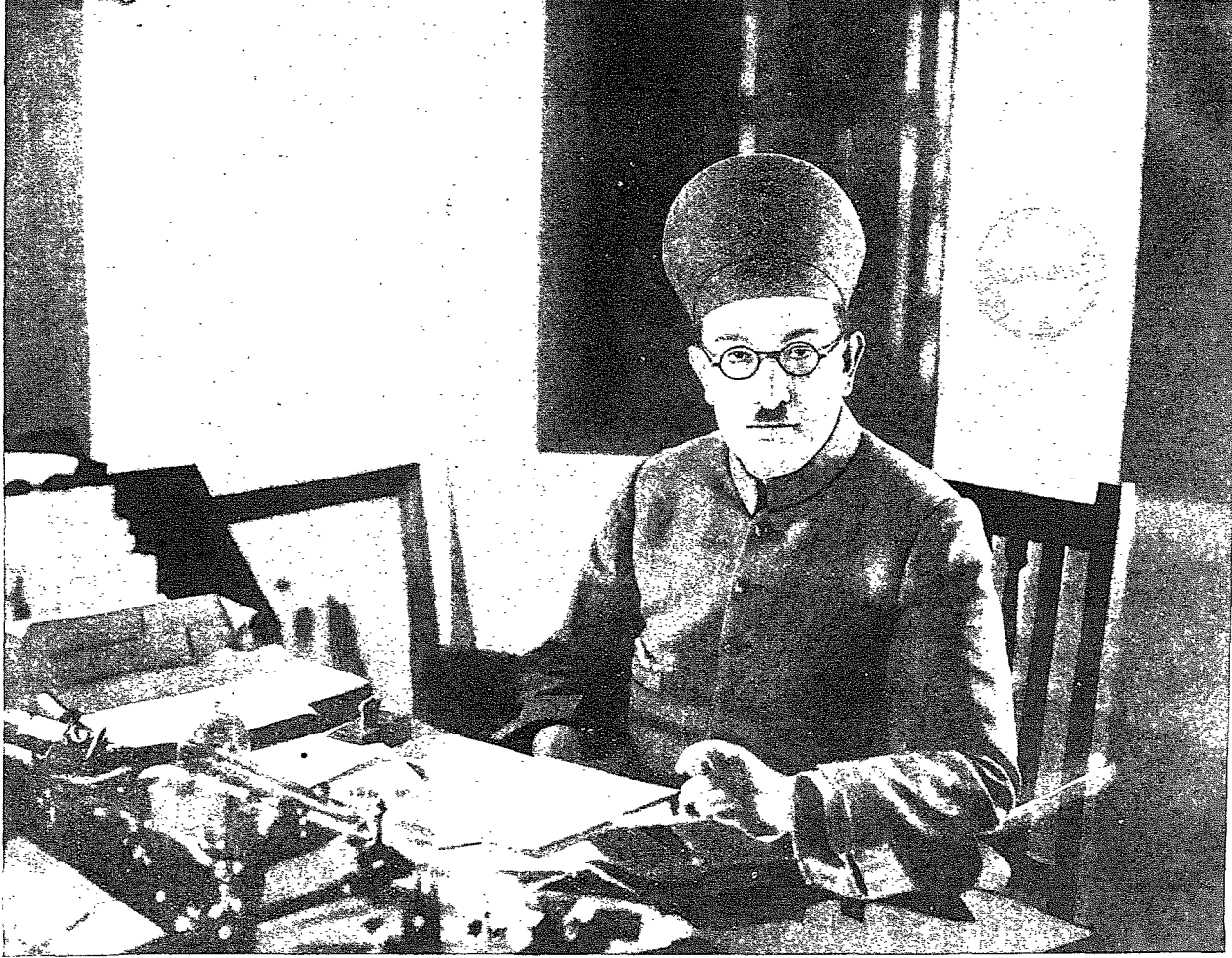
نواب مسدھی یار جنگ جماد