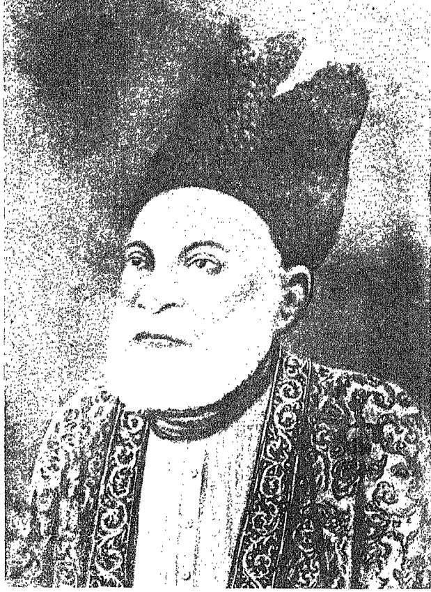
مرزا اسد اللہ خان غالب نظام جنگ بحکم الدولہ دبیر الملک